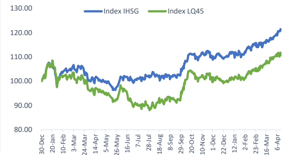
Index Movement (Base: 2020)