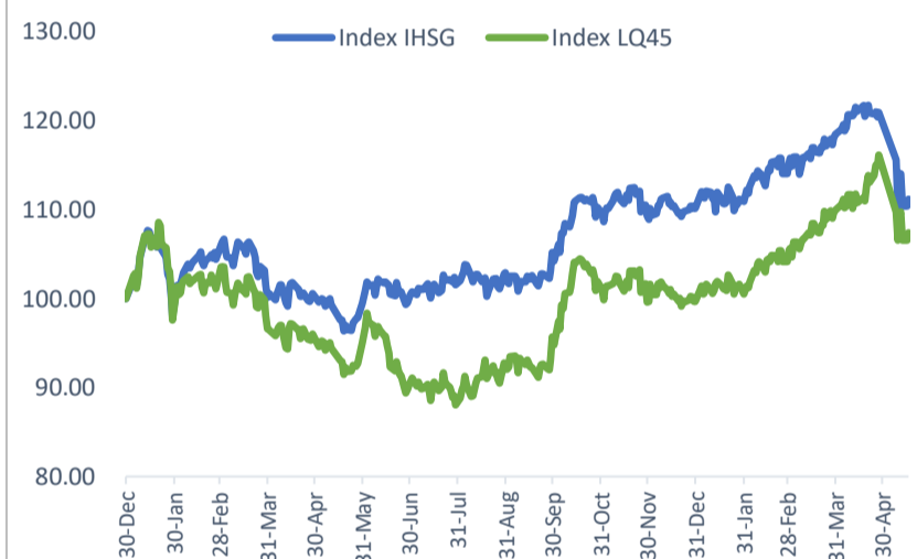
Index Movement (Base: 2020)