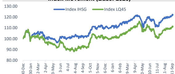
Index Movement (Base: 2020)