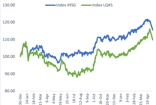
Index Movement (Base: 2020)